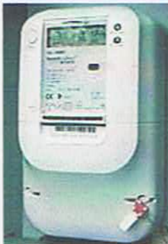
Box mit GPRS-Sender und PLC System