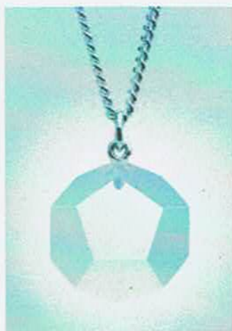
Energiestern in Acryl zum Tragen.

Von Kunden genannt werden: Mehr Energie, größere Wachheit, mehr Konzentration, besserer Durchblick, mehr Selbstsicherheit (z. B. gegenüber dem Vorgesetzten), ein Gefühl des Schutzes, mehr Toleranz, Gelassenheit, Heiterkeit, mehr Bereitschaft zu verzeihen und sich auszusöhnen und eine