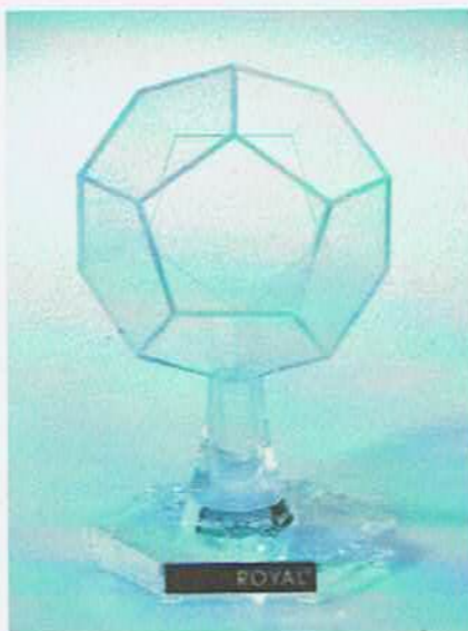
Der große Bruder: Energiestern Plus.

geringere Neigung zu Aggressionen und Depressionen.