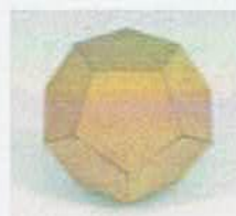
Im Dodekaeder finden sich alle platonischen Körper und über 720 Goldene Schnitte.