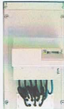
Box ohne Sender aber mit PLC System

Erste Wirkungen: Viele körperliche und seelische Beschwerden bei Menschen, ungeheure Schlafstörungen, andauernder kurzer Stromausfall, Lampen explodieren, Mobilverkehr teilweise zusammengebrochen, Telefone funktionieren nicht, Stromstärke und Strahlung in der Stromleitung unglaublich gestiegen, Computer knacken furchtbar, Internet und Mailverkehr humpelt, Lampen flackern die ganze Zeit usw. Auch die EI-Allergiker fallen haufenweise um und fühlen sich sterbend. Viele zeigen jetzt schon Persönlichkeitsveränderungen und andere Bewusstseinsstörungen, besonders im Bezug auf das Gedächtnis. Alles nur, wegen diesem kleinen Sender, der eigentlich keine Beeinflussung auf das Stromnetz haben sollte. ODER ?